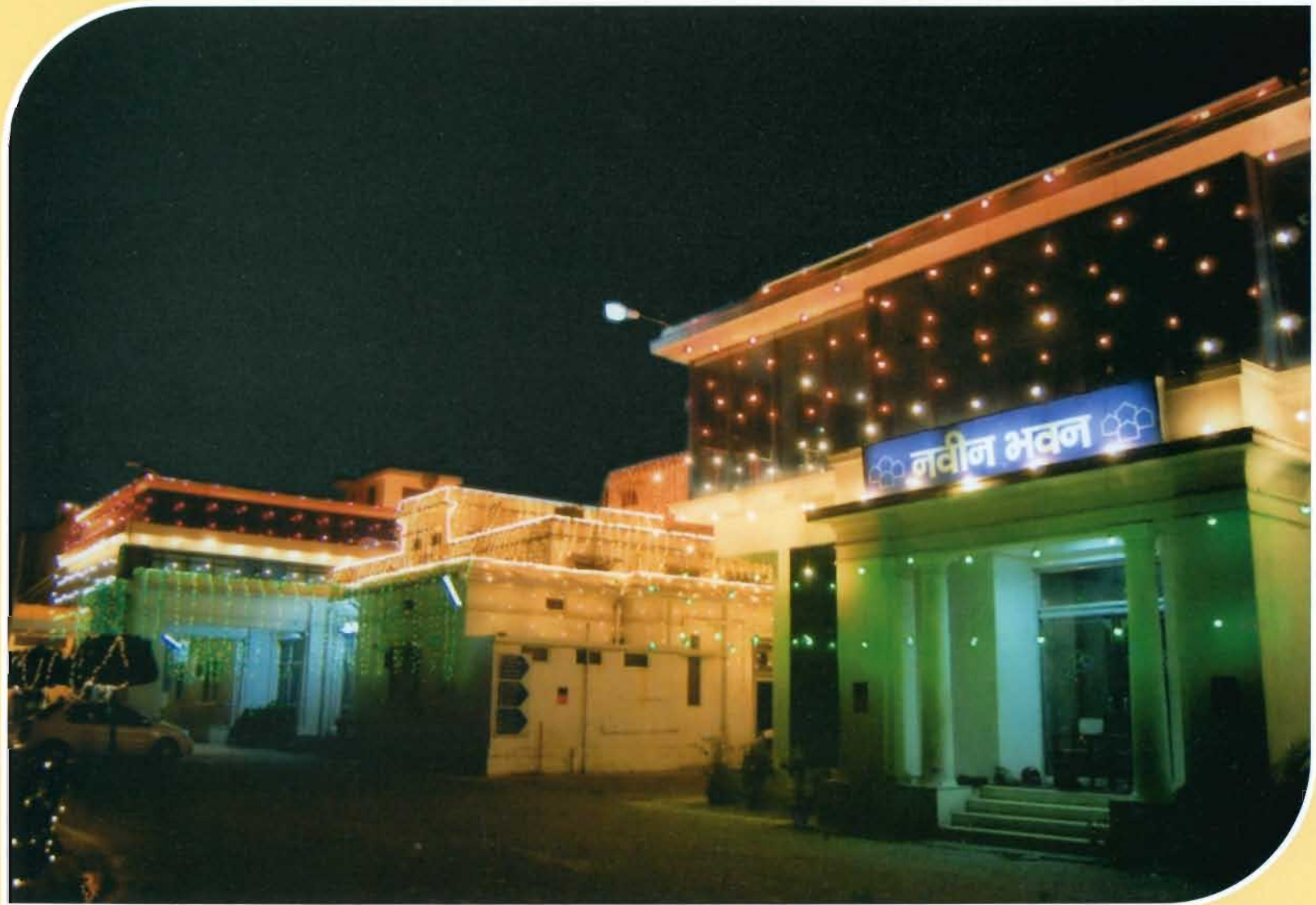
15 अगस्त सजावट का एक दृश्य